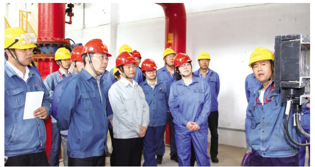
5月7日,利海化工公司举行公司领导班子及中层管理人员消防安全知识培训,采用理论与实践相结合,实地检验,随时解答的方式,要求掌握必要的消防安全知识和技能,熟悉并正确使用各种消防器材。图为安全管理人员讲解如何启动消防水泵应急电源。(黄鑫)