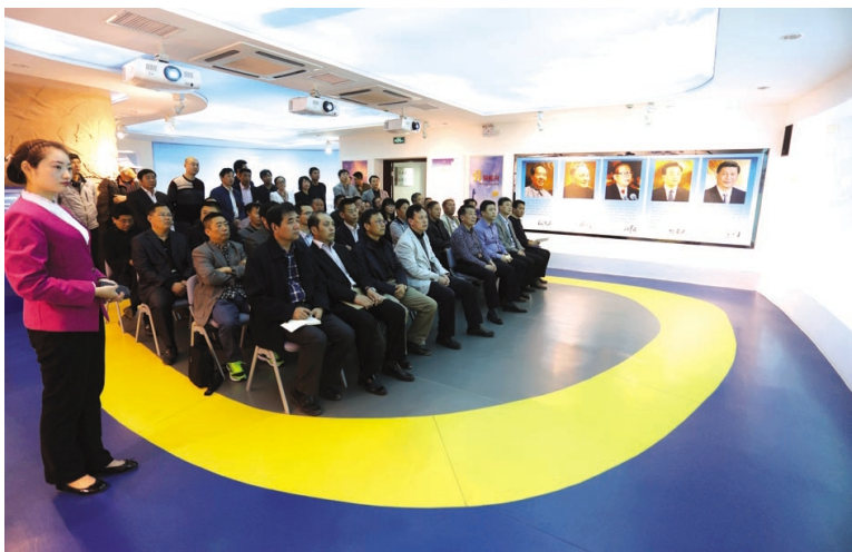
为切实加强廉政警示教育,进一步提高管理人员拒腐防变能力和廉洁自律意识。“五一”节前,台北投资公司纪委组织中层管理人员、重点岗位人员和所属单位党政工主要负责人到市清风苑警示教育基地接受警示教育。(孙小玲 韩挺)