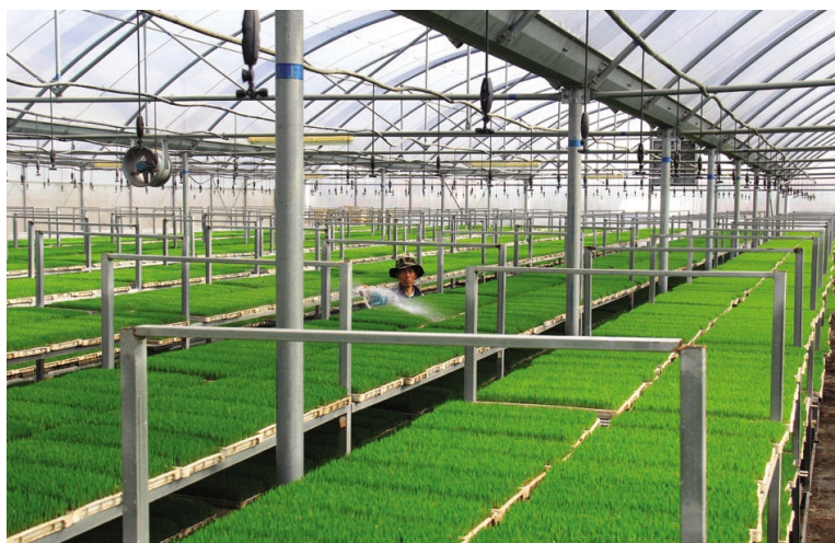
近日,人民日报、新华日报同时刊登了今春青口公司工厂化育秧大棚养护秧苗资讯。两大重量级媒体将此苏北最大的工厂化立体式水稻育秧基地定义为“水稻工厂”,进一步扩大了该公司工厂化育秧的社会影响力。