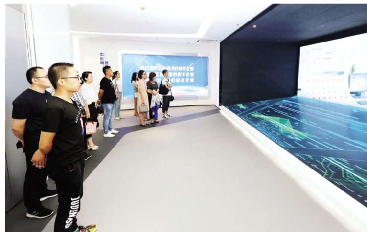
8月1日下午,连云港市广播电视台、连云港报社、苍梧晚报社《苍年新闻·故事》栏目组走进徐圩投资公司拍摄及采访,讲述工投故事,见证改革开放以来,盐业发展带给港城的变迁,以及为江苏沿海大开发作出的巨大贡献。(王茜)