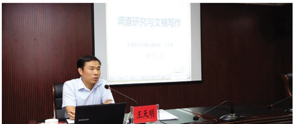
为提升政务工作人员的专业素养和岗位能力,更好服务集团“高质发展、后发先至”,8月10日下午,集团公司举办政务工作培训班,邀请市委研究室城市调研处处长王天明、市委办公室信息处处长郑晓卫对公文写作与调查研究以及政务信息写作等方面知识作专题辅导培训。各单位及集团总部共 68 名政务及信息工作人员参加培训。(工宣)