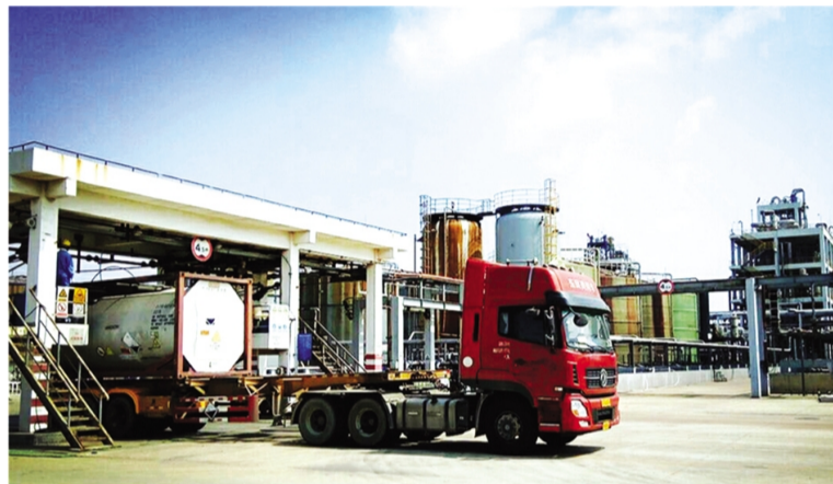
面对氯化苈市场下行的严峻销售形势,利海公司适时调整营销策略,加大氯化苈产品外销力度,寻求新的突破。8月8日,该公司出口氯化苈产品45吨。截止目前实现氯化苈产品出口450吨,力争全年出口1000吨。(顾孟陈 顾孟)

面对晴热高温天气的挑战,供电工程分公司广大员工毫不退缩。仅7月中上旬,已完成抢修10余次,工程项目5个,处理各种用电故障20起。他们以饱满的热情、顽强的精神、坚强的毅力、务实的作风,充分展现了不怕苦、不怕累、敢于拼搏的精神。(王志勇 王学忠 周国成)