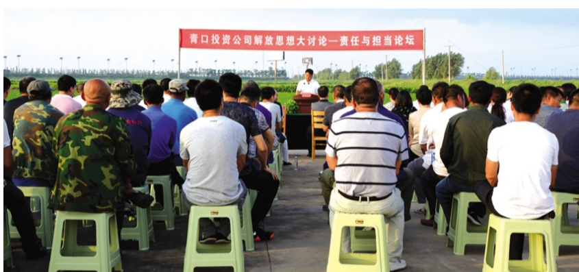
为了进一步落实解放思想大讨论的部署安排,青口投资公司党委结合“三色经济”发展实际,通过实景教育课堂进田间的形式,将解放思想大讨论活动搬进了生机盎然的农业生产现场,让公司全体干部在清晨的稻田中接受了一次“责任与担当”的思想洗礼。(杜娟)

“流动党课”在身边。着力开展“不下课”的党课课堂活动。开设“班车上的党课”,将学习视频文件下载到车载电视上播放。开展“职工餐桌上的党课”,通过餐厅电视播放学习内容,利用吃饭间隙穿插学习党建知识,让党员和职工群众中午就餐享受精神食粮。(顾孟 姜红来)