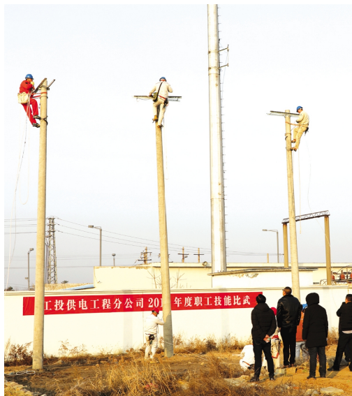
为更好培养爱岗敬业、技艺精湛的技术工人,供电公司于1月24日在台北供电所开展“职工技能比武”活动以及工艺流程和安全规范考试,推动员工技能水平和整体素质的提升,为构建“平安供电”提供安全保障。(电宣)

裕升、裕欣、裕祥三家养护公司组织绿化、保洁人员配合除雪车、装载机、机械铲对花果山大道、黄海大道、东方大道、242省道、新光路及大浦路等主干道进行清雪作业;对程圩桥、先锋大桥等桥面易积雪路段以及马山路立交、新光路涵洞等“上跨下穿”路段采用撒氯化钙的方式,加速积雪融化,并安排人员及时扫除积雪,防止路面因低温降雪产生冰冻,对交通安全造成影响;对创智绿园广场、火车站广场及匝道等窗口地段采用人机结合的形式清扫积雪。盛达市政公司、瑞泰服务公司以及益丰园林公司在提供铲车、平板车、装载机机械车辆配合扫雪的同时,积极做好后勤服务,为清雪工作有序开展提供保障。截至到中午,各条主干道积雪已基本清理完毕,道路恢复畅通,保障居民出行和交通安全。(王芬)