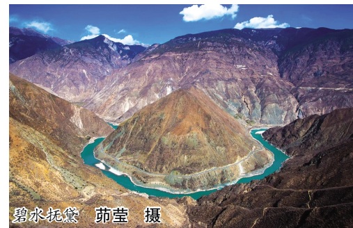
碧水绕黛

尘土全扫出来;如果天气晴好,还会把被褥、家具及锅碗瓢盆全部搬到院子里,我和哥哥的任务就是将所有的锅碗瓢盆、椅子沙发擦洗干净,一天忙下来,等把所有东西都复位了,天也快黑了,肚子也饿的咕咕叫了。 现在,“扫年”——这个尘土飞扬、锅碗叮当的新年序曲,也随着都市的脚步,逐步时尚和另类起来。特别是那些工作繁忙的精英一族会选择专门的清洁公司来做,专业清扫效率高、效果好,可以在最短的时间里,让家的形象焕然一新。时代虽然在变,但不变的是习俗。人们用“扫年”这种方式,寄托了辞旧迎新、迎祥纳福的美好愿望,增添了浓浓的年味!