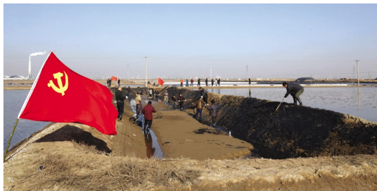
1月22日,徐圩安邦公司党支部组织30余名员工组成“突击队”,齐赴“手牵手、互帮助”对接单位—农工商西港服务区,协助做好冬准“三个一”滩内工程,并与农工商公司对接落实相关工作事宜。