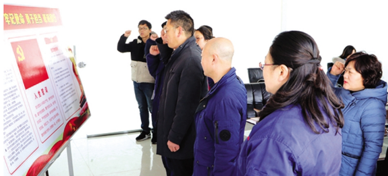
春节前夕,集团各基层党支部按照统一性、多样性、服务性的要求,认真组织开展“坚定信心勇担当,乘势而上求突破”主题党日,凝聚正能量,传播好声音。图为神特新材料公司党支部结合“大干一季度,冲刺开门红”中心工作,集中党员重温入党誓词。