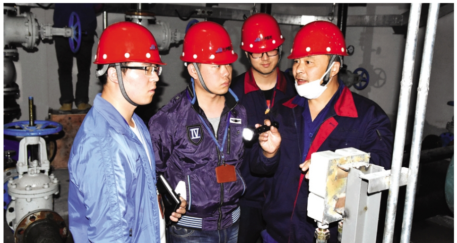
近年来,氨纶公司积极开展班组文化建设,以文化建设促进班组建设水平的提升,进而打造富有凝聚力、战斗力的班组员工队伍,以促进企业蓬勃发展。图为该公司开展的“一师带多徒”现场教学活动。(氨纶宣)

抓好安全隐患排查、整改督查,紧盯“关键时”。在安全生产大排查、大整治专项行动中,重点加强“两重点一重大”(重点危险工艺、重点监管危化品,重大危险源)安全排查。通过安全互查、部门检查、公司综合检查等多种检查形式,开展生产安全隐患大排查督查,查出安全隐患14条,下发6份整改通知单,已整改12条,2条尚在整改期限内。近期,将对查出的问题整改情况进行“回头看”,坚持对安全隐患零容忍、动真格。(郁洪兵 刘传剑)