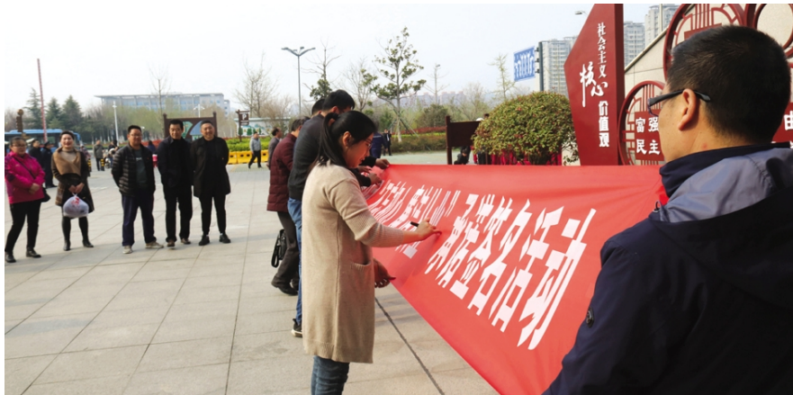
近日,航运公司纪委组织党员干部开展“不忘初心,廉洁从业”党员签名承诺活动,共有20多名党员干部在横幅上共同签上了自己的名字,承诺不忘初心,牢记使命,廉洁从业。(卢新全)

效能提升,整治作风问题。为确保纪检监察工作抓出成效,落实领导责任,强化督促检查,不断完善工作机制,通过对已完成工程“回头看”、聘请党风廉政监督员等方法对大宗物资采购、物业收费管理、项目分包及公司内部招标投标管理等关键点提高监督质效,强化纪检监察力量。(卜艺琳)