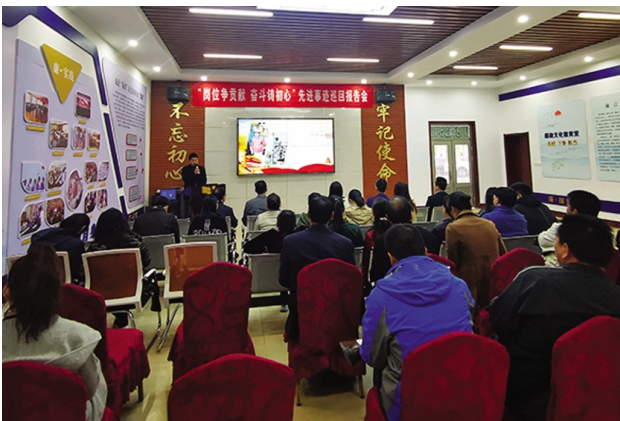
为深入开展“不忘初心、牢记使命”主题教育,11月8日上午,台北投资公司党委举办“岗位争贡献、奋斗铸初心”先进事迹巡回报告会,来自各单位的6名讲述人诉说着属于他们自己或者身边人的先进事迹。(张会鹏)