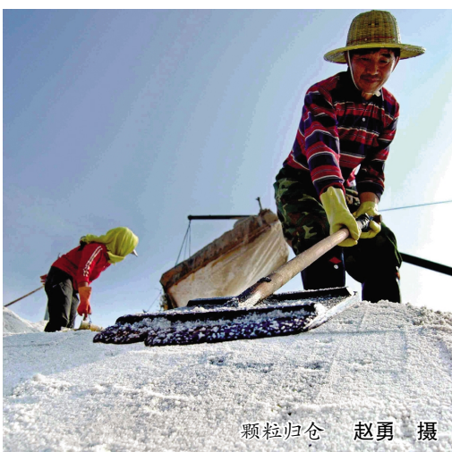
颗粒归仓