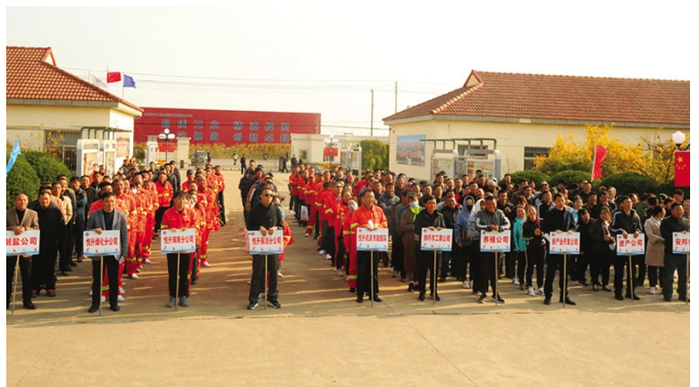
11月4日上午，徐圩投资公司第十二届职工“文体周”隆重开幕，本届“文体周”共组织12支代表队700余人次参赛队员在拔河、台球、跳绳、摸石过河、篮球赛、掷蛋、诵读、排球、门球等12个项目比赛中，展开为期一周的奋力角逐。（戴月婷）