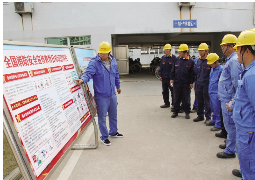
11月7日，利华化工公司开展“119消防日”宣传活动，围绕“防范火灾风险、建设美好家园”主题，在宣传形式、宣传力度、宣传效果上下功夫，为构建平安利华营造良好的消防安全环境。图为安环卫工作人员讲解消防安全宣传知识。