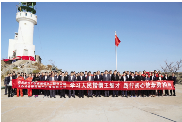
为推进“不忘初心、牢记使命”主题教育走深做实,近日,供电公司、房地产公司利用结对共建平台,组织100多名党员赴开山岛开展主题党日活动。广大党员们进一步加深了对初心和使命的认识,为企业的高质量发展贡献力量。(电宣房宣)

专题党课学。集团分管领导到公司作《践行初心使命,做大做强神特事业》专题党课,围绕“四个讲清楚”,深入解读对新思想的认识领会。开发区环保局局长到公司上专题党课,作环保形势任务报告。公司党支部书记作《不忘初心、牢记使命,担当作为推动神特公司高质量发展》专题党课,明确责任使命。(神特宣)