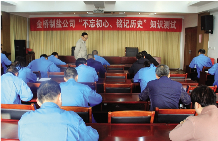
为扎实推进“不忘初心、牢记使命”主题教育,促进党员干部学党史、国史、企业文化等知识,11月8日,金桥制盐公司开展“不忘初心、铭记历史”知识测试活动,中层副职以上管理人员参加了考试。(金宣)