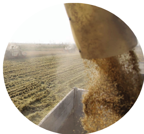
11月4日上午，青口投资公司万亩水稻正式开镰。按照水稻品种和烤田情况，成立工作小组，预计11月20日前完成全面收割任务。（顾益）