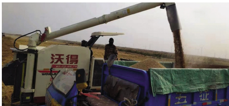
11月6日，灌西明威农业公司万亩农田进入开镰收割阶段。今年，该公司面对大旱之年的严峻形势，全体干群齐心协力生产自救，自种自营的2000余亩水稻预计平均亩产将突破千斤，全年丰产丰收在望。（胡继军）